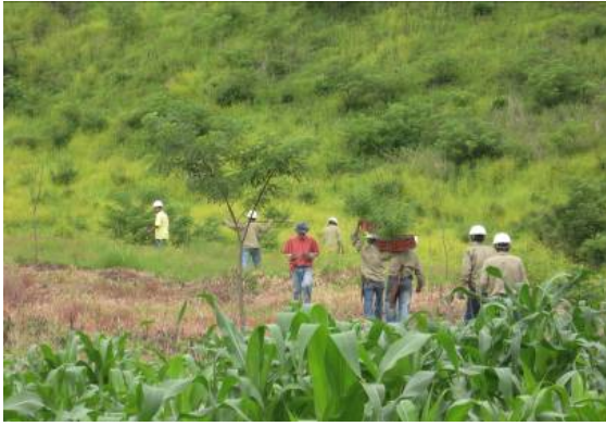
Jornada de plantación en el ANP El Playón