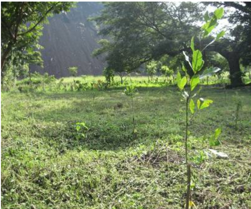
Especies forestales y frutales plantadas en el ANP El Playón