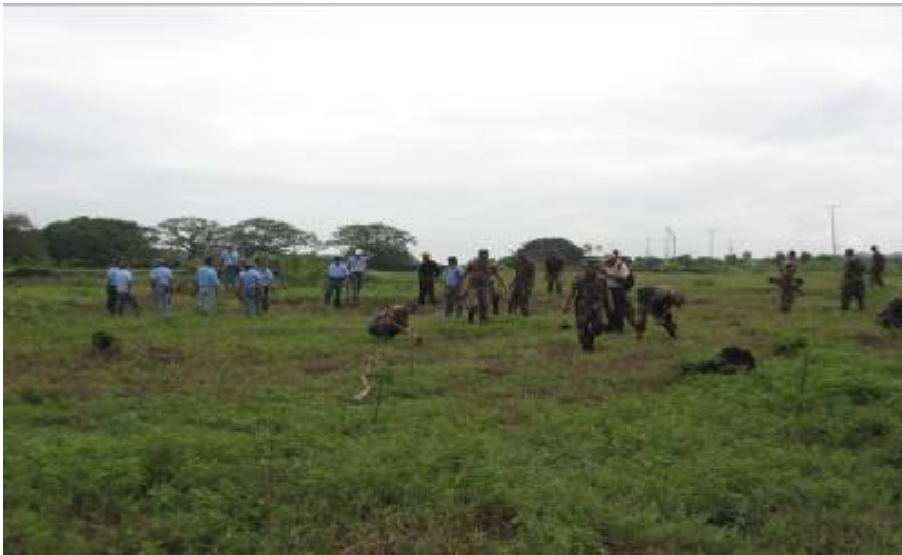
Jornada de reforestación en el ANP El Playón